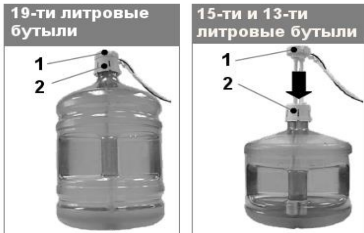
Рис.2 Установка сифона на бутылки с водой

Уберите бутылку внутрь шкафчика и закройте дверцу шкафчика.