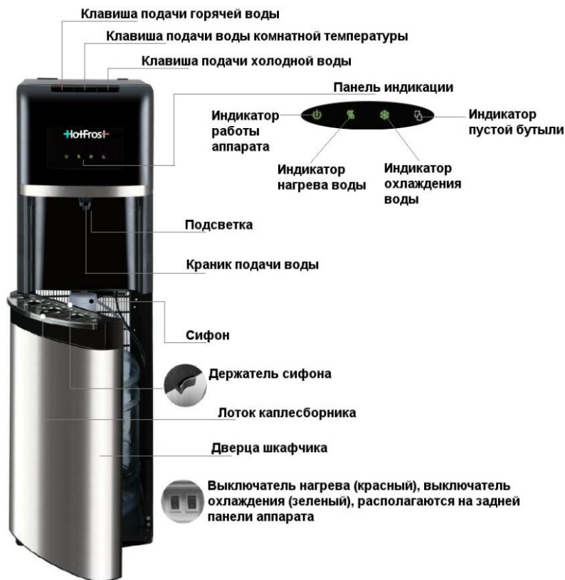
Рис.1 (а) Схема аппарата 35AEN